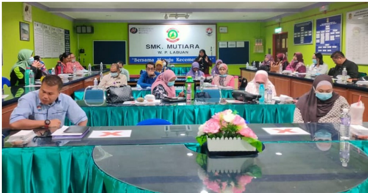
Para guru dan Pegawai SPb yang hadir semasa sesi dialog