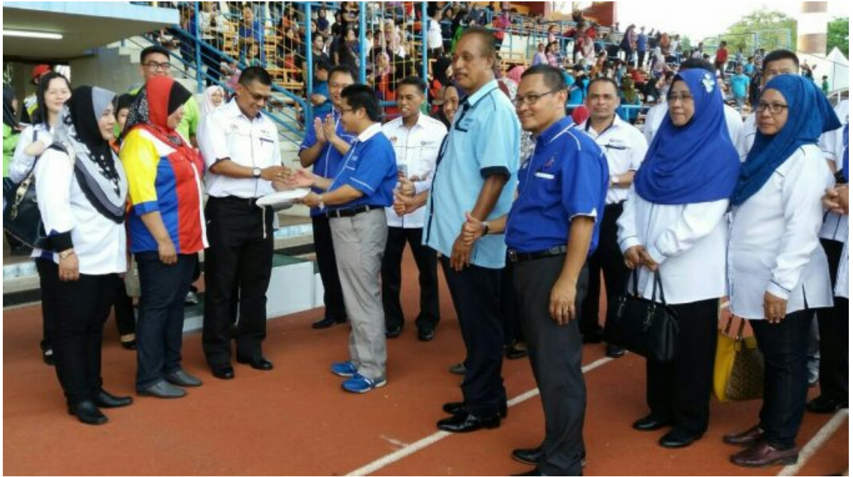
Serahan bendera kejohanan kepada tuan rumah 2018