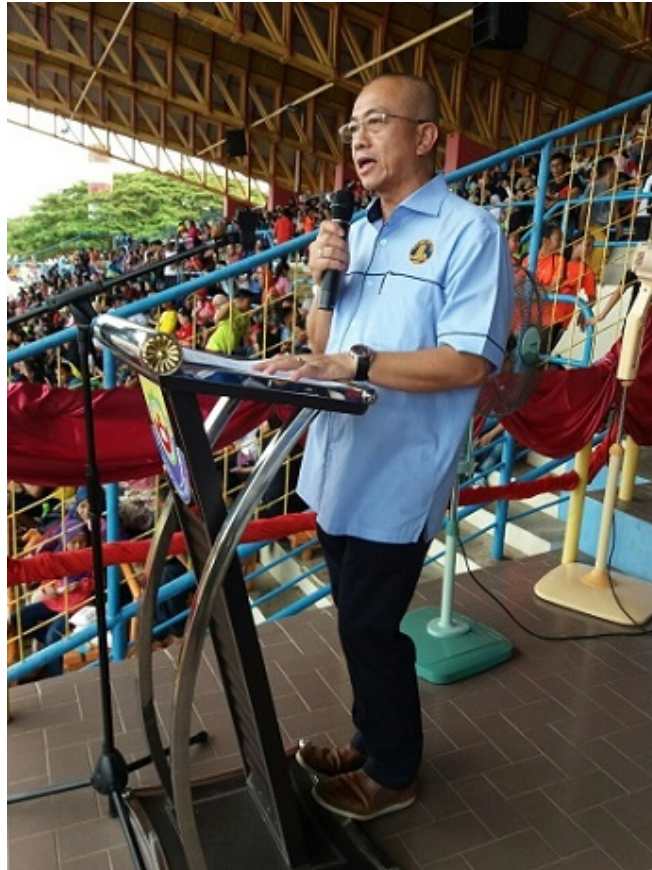
Ucapan perasmian oleh YB Datuk Rozman

“Kejohanan ini juga adalah landasan ke arah perpaduan, menjalin sifat hormat menghormati dan semangat kerjasama yang tinggi. Matlamat akhirnya nanti adalah untuk membentuk sebuah masyarakat yang berjiwa kental dan bersemangat patriotik”, katanya lagi.