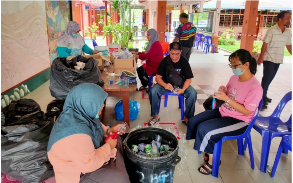
Guru dan Ibu Bapa berganding bahu menyiapkan projek Jalur Gemilang SMK Mutiara