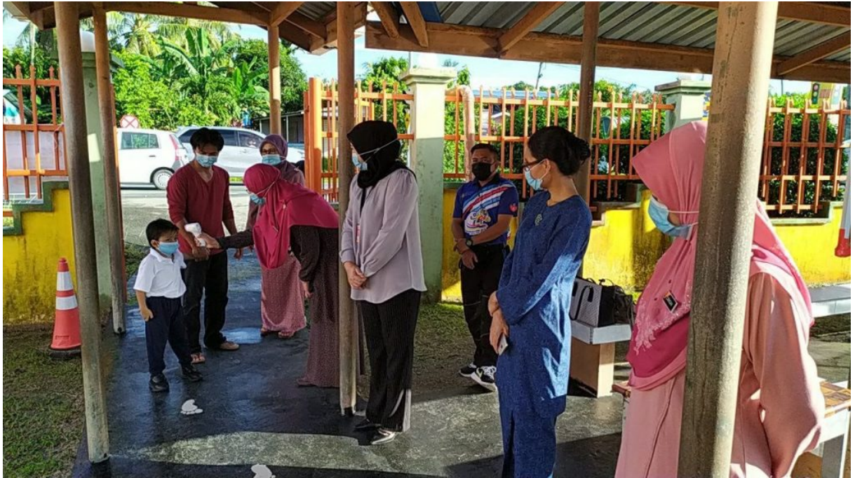
Menyukat suhu apabila tiba di perkarangan sekolah.