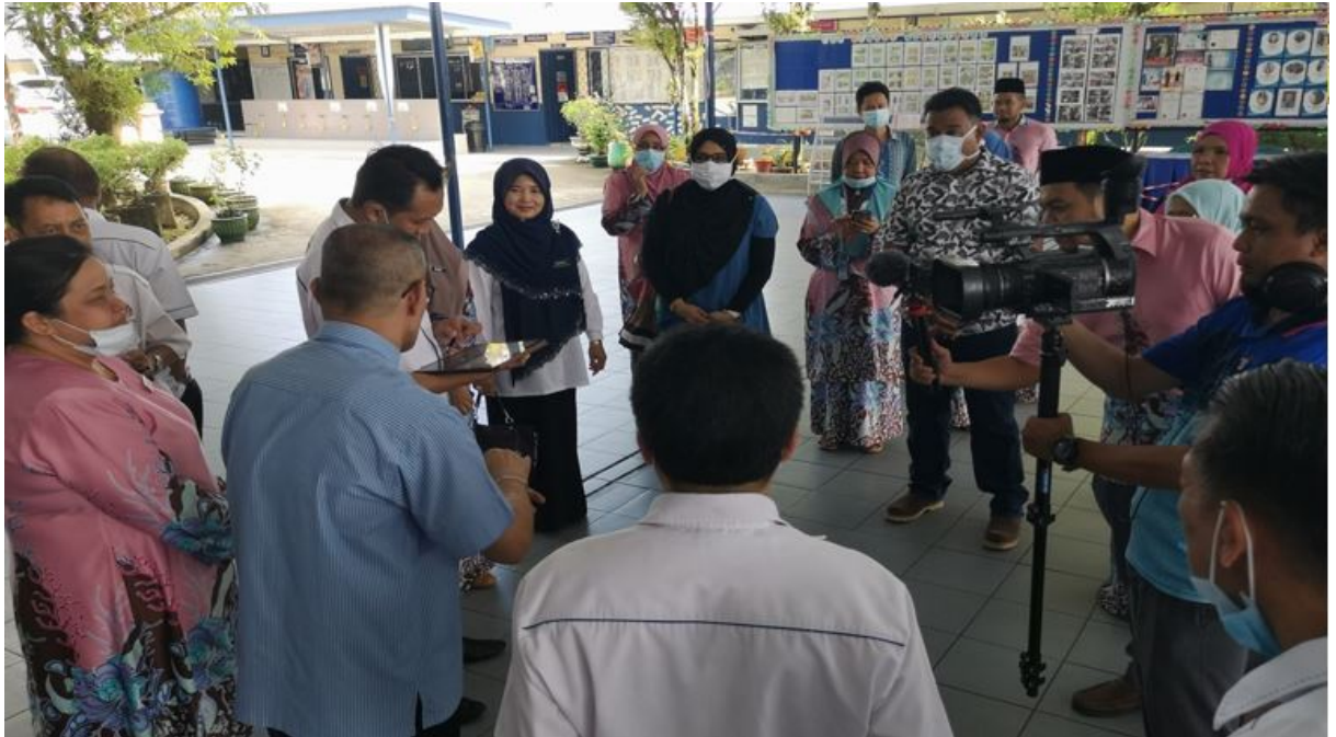
Taklimat hasil pemantauan

P2MP Menjadi Program Berkesan Ketika Sekolah Normal Baharu – Pusat Sumber DSDN SMK Ranche- Ranche