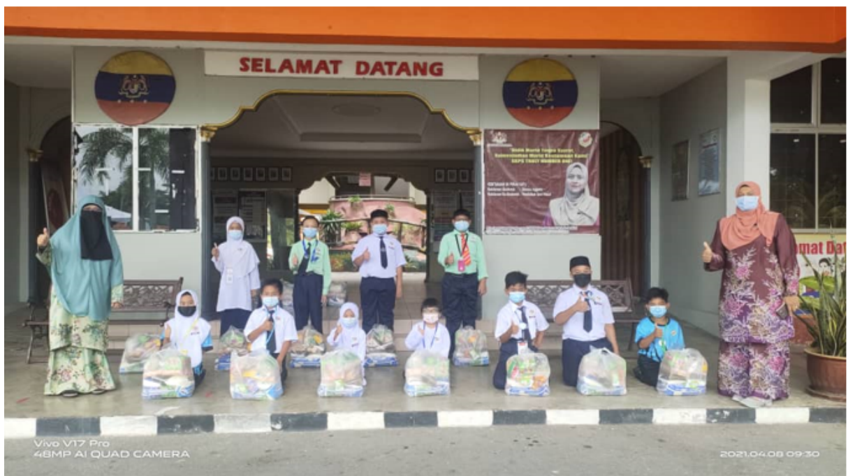
Labuan, 08 April– Program Muslimah Dhuha, Perumahan Sabah Gas Ranche2 merupakan program khas bertujuan menyampaikan