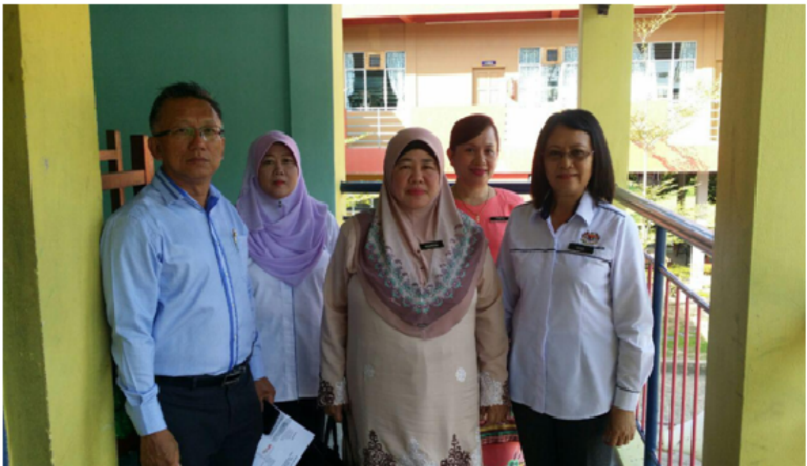
Puan Maimoon Binti Hj. Matnoh ( Tengah ) menghadiri dan merasmikan mesyuarat agung PIBG SM St. Anthony pada 10 Mac 2018

Mesyuarat PIBG pada kali ini telah dirasmikan oleh yang berbahagia Puan Maimoon Binti Matnoh selaku Ketua Sektor Pengurusan Sekolah, JPN W.P Labuan . Dalam ucapan perasmian beliau memuji sokongan padu PIBG SM St. Anthony kepada pihak sekolah. Usaha ini sejajar dengan matlamat Pelan Pembangunan Pendidikan Malaysia ( PPPM 2013 – 2015 ) untuk meningkatkan penglibatan dan peranan ibu bapa dan komuniti di sekolah. Puan Maimoon juga menyatakan tugas dan peranan PIBG di sekolah termasuklah membantu pihak sekolah menambah kewangan bagi meningkatkan kemudahan fizikal bagi tujuan meningkatkan kemudahan pengajaran dan pembelajaran.