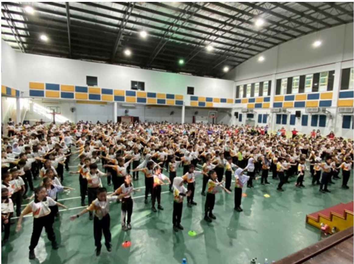
Suasana di dalam dewan semasa murid-murid membuat senaman aerobik bersama-sama.