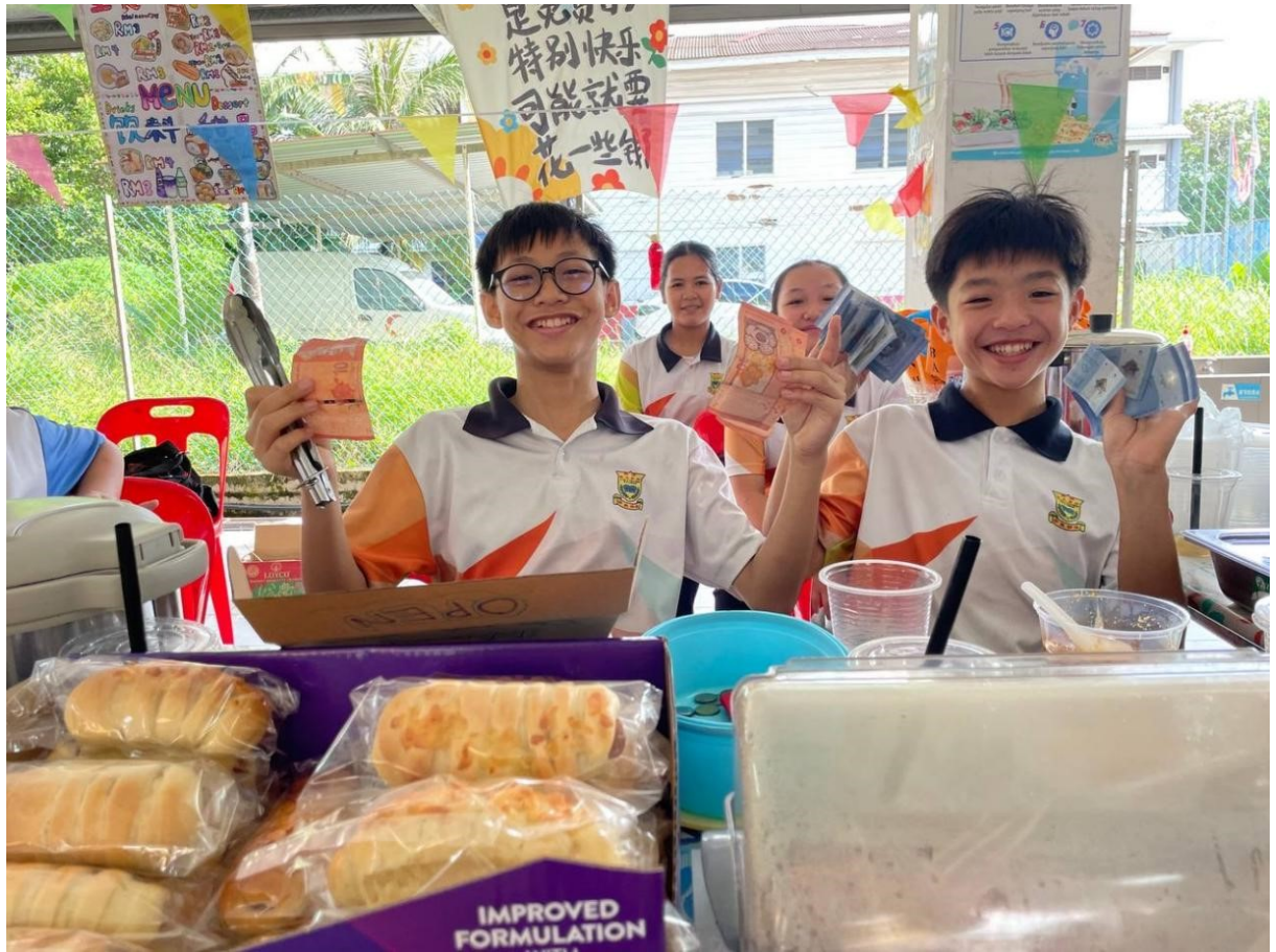
Murid gembira menunjukkan hasil yang dapat melalui jualan makanan.