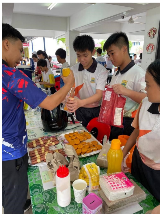
Murid sedang menjual makanan ringan kepada guru.