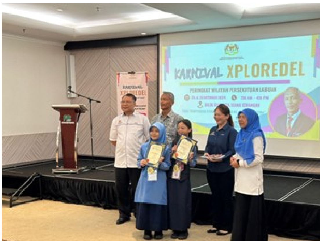
Penyampaian sijil penghargaan dan pingat daripada pihak Jabatan Pendidikan W.P. Labuan kepada SK Layang-layangan.