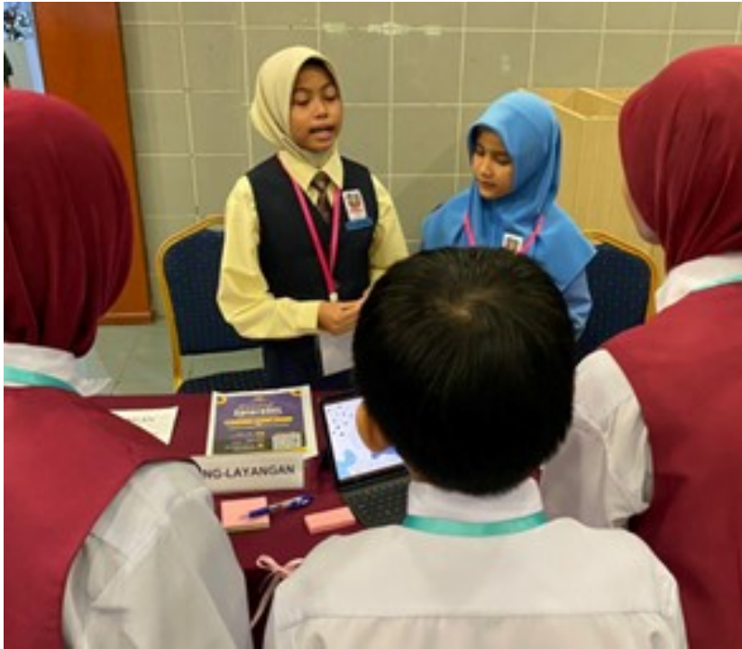
Suasana ketika pembentangan sedang dijalankan di hadapan para juri dan murid-murid dari sekolah lain.