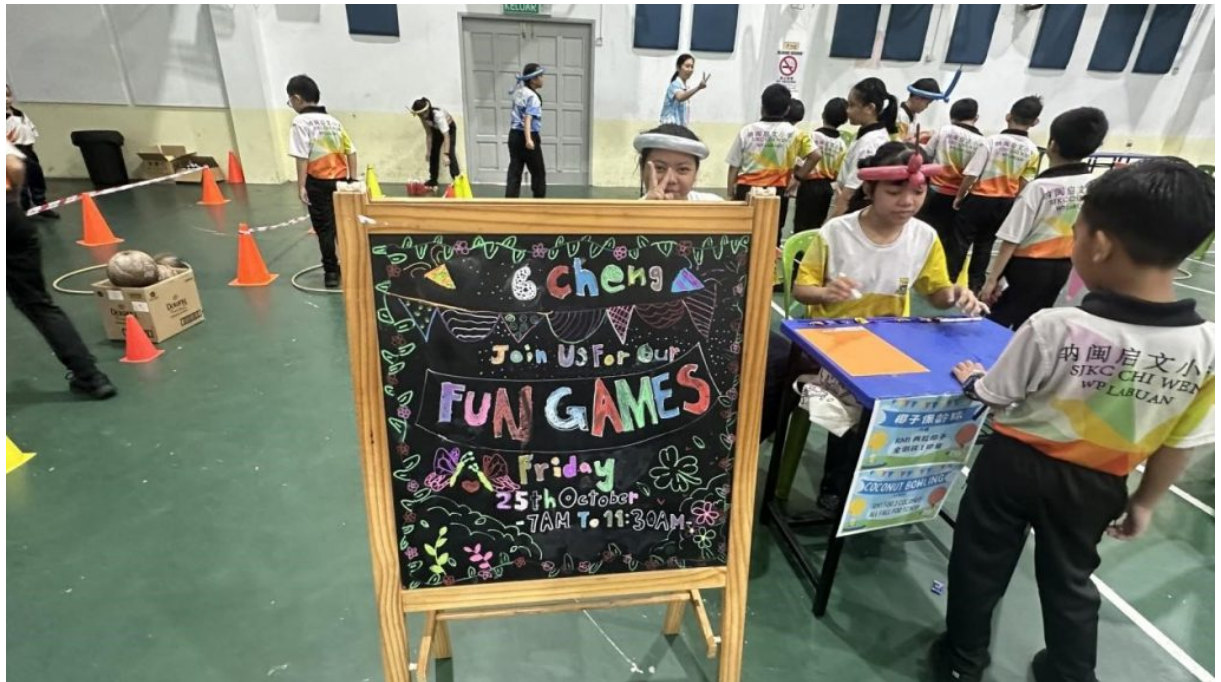
Stesen permainan tahun 6 Cheng.