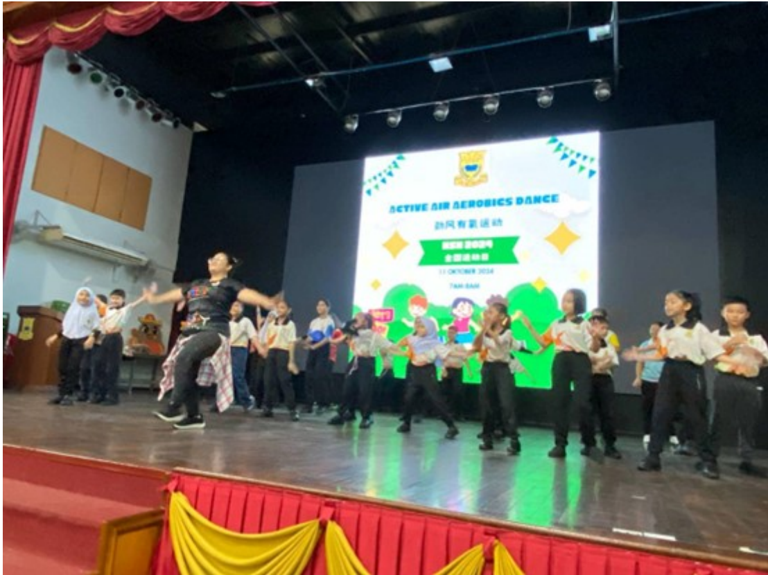
Suasana di dalam dewan semasa murid-murid membuat senaman aerobik bersama-sama.