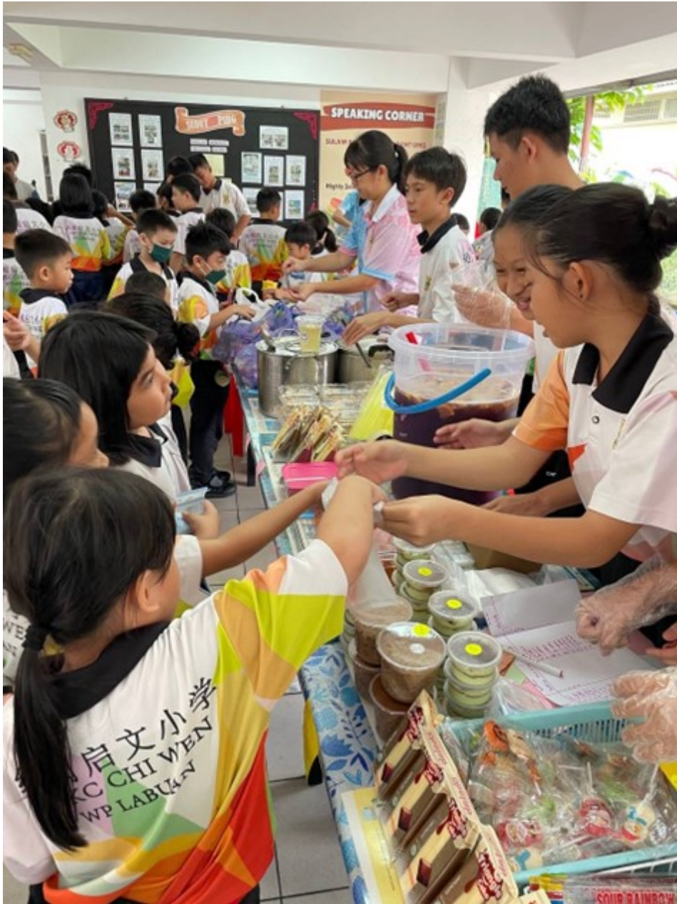
Suasana murid tahap rendah membeli makanan dengan murid tahun 6.