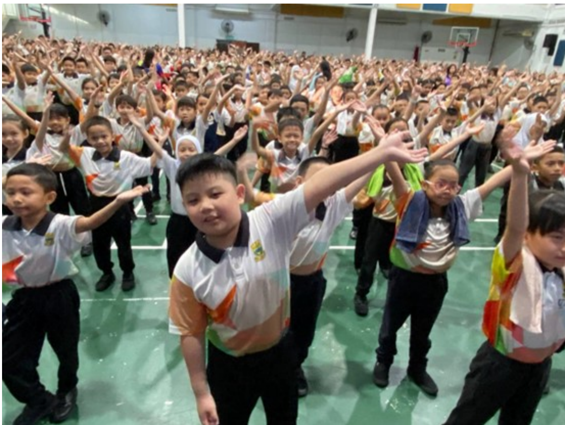
Suasana di dalam dewan semasa murid-murid membuat senaman aerobik bersama-sama.