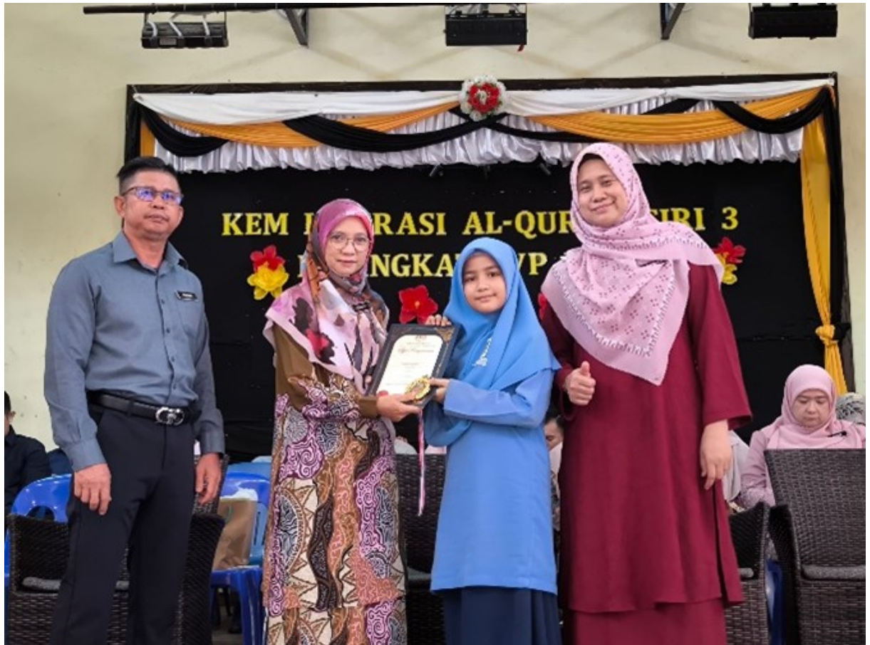
Penyampaian semula sijil penghargaan dan pingat daripada pihak sekolah.