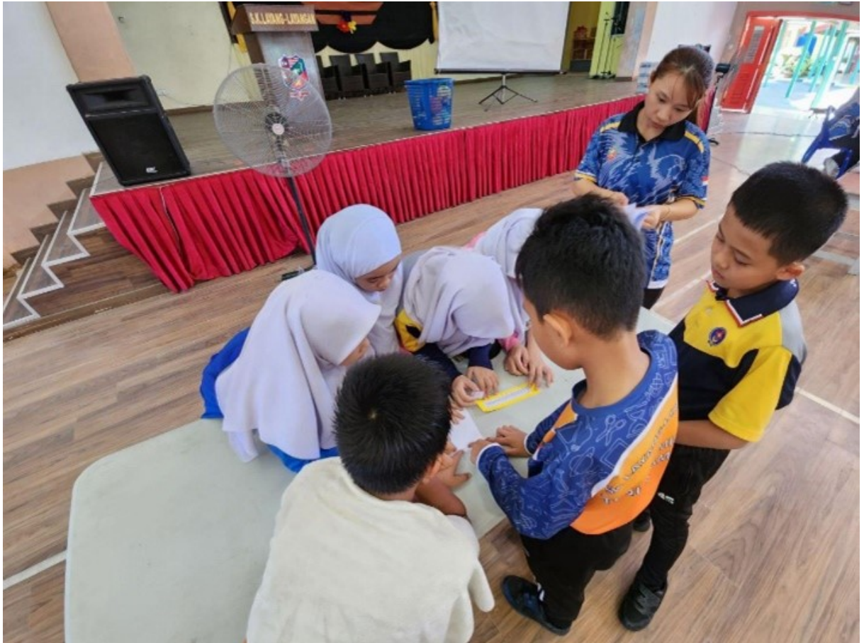
Murid-murid menunjukkan minat dan penglibatan yang aktif terhadap setiap tugas