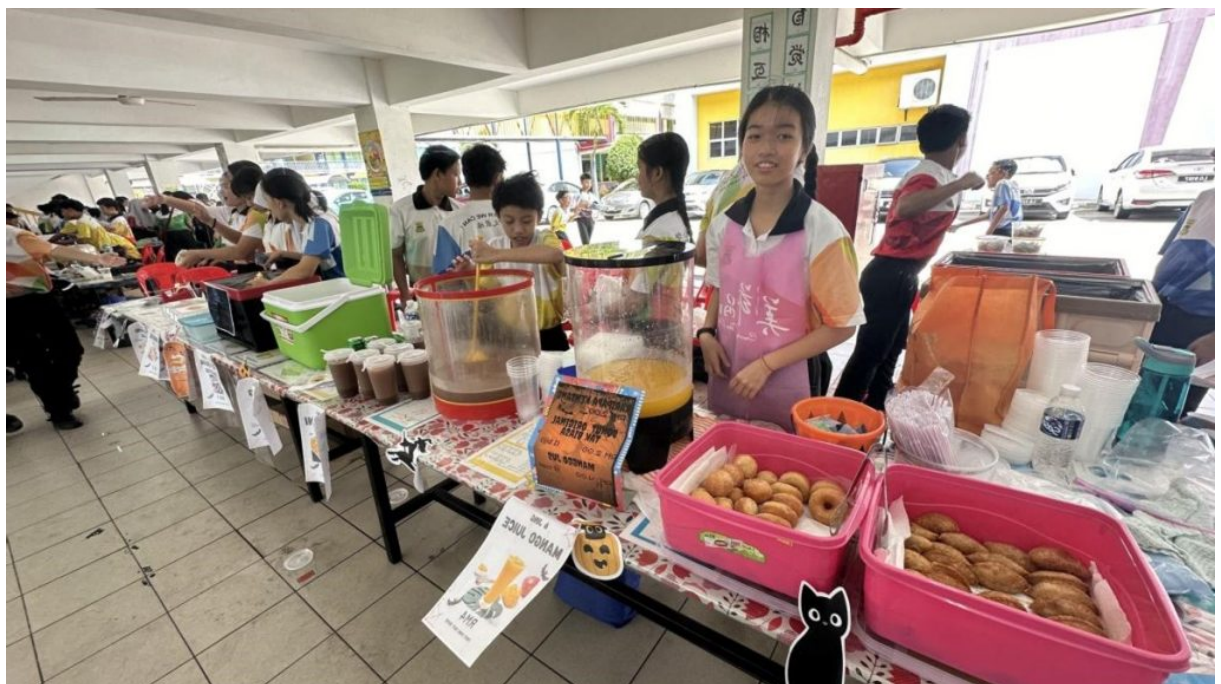
Suasana gerai makan murid tahun 6. Berita Oleh : SJKC Chi Wen