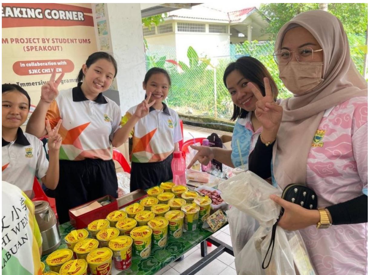
Murid menjual makanan MEECUP kepada guru.

Dengan sokongan yang tidak berbelah bahagi daripada semua pihak, Hari Kantin dan Hari Keusahawanan SJKC Chi Wen tahun ini dianggap sebagai satu kejayaan besar, sekaligus menjadi inspirasi untuk acara-acara mendatang.