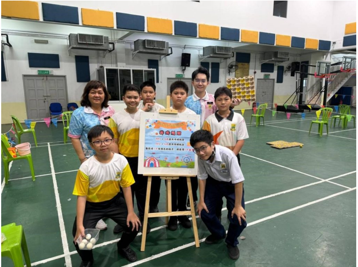
Murid dengan guru di aktiviti stesen permainan.