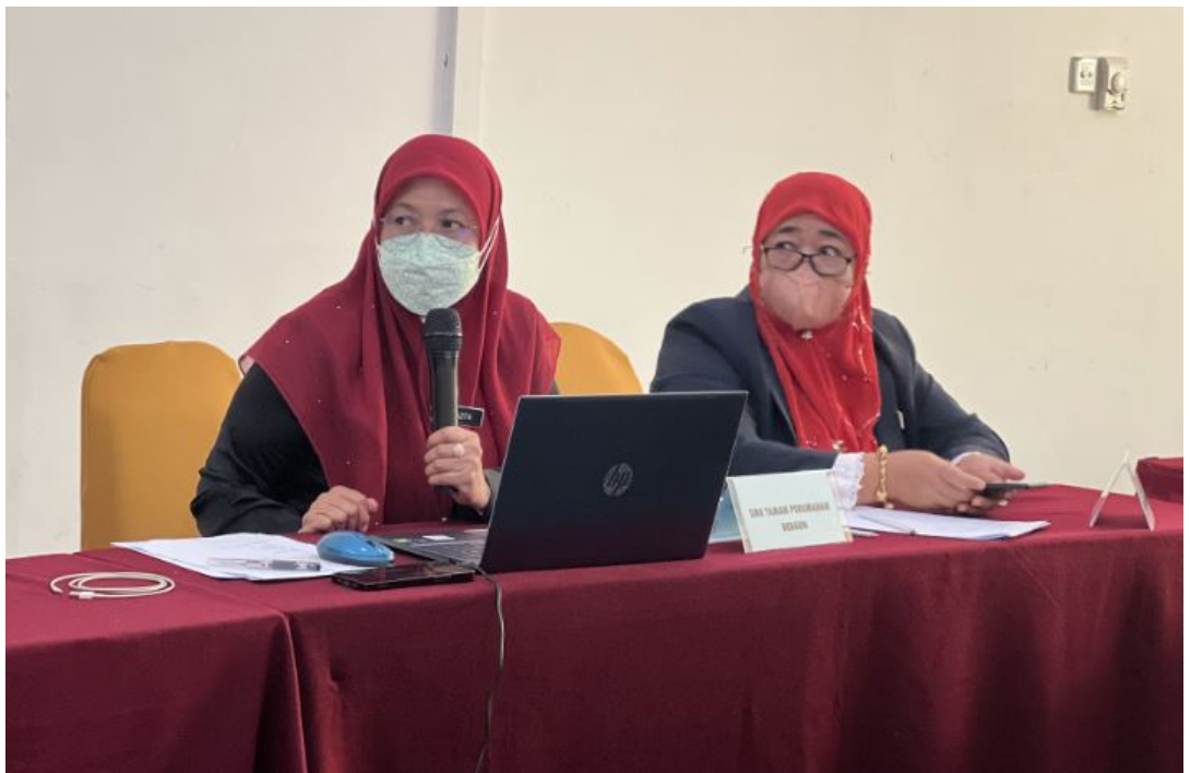
Pelan Tindakan, Intervensi