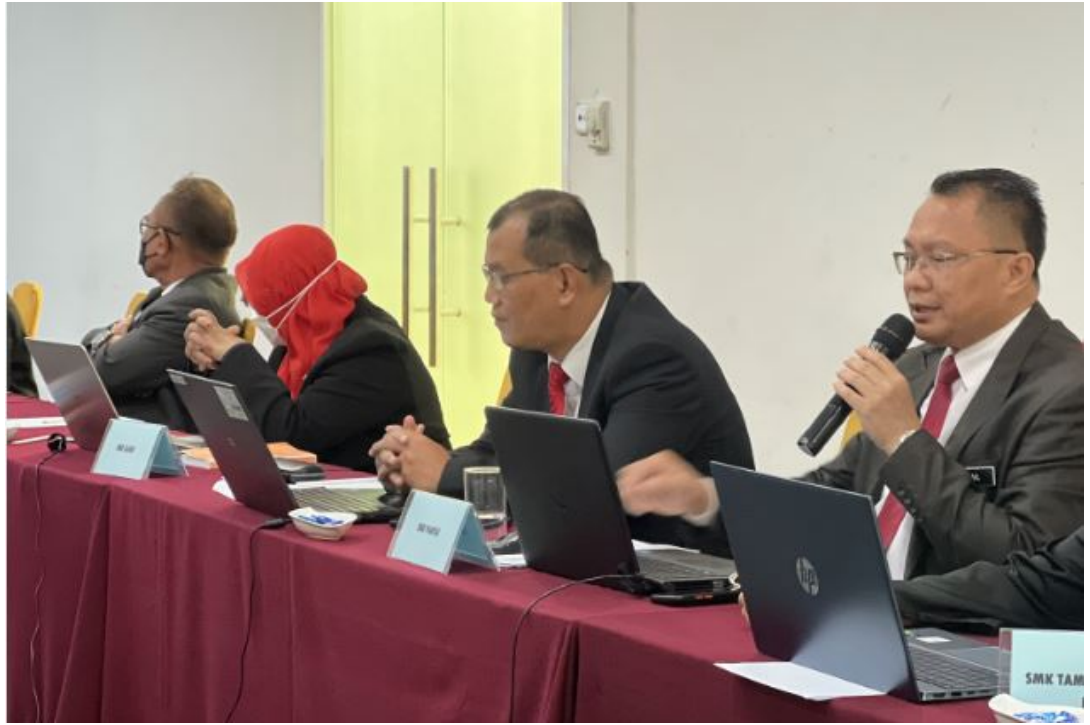
Post-Mortem, Task Force SPM