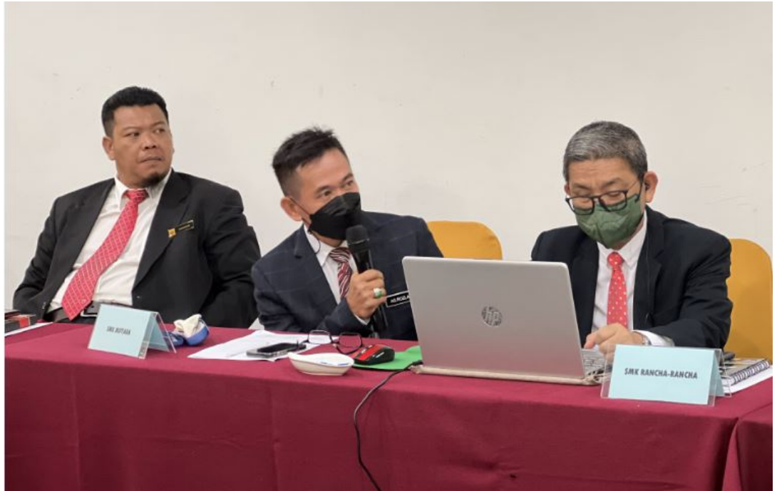
Perkongsian, Perbincangan dan Pembentangan