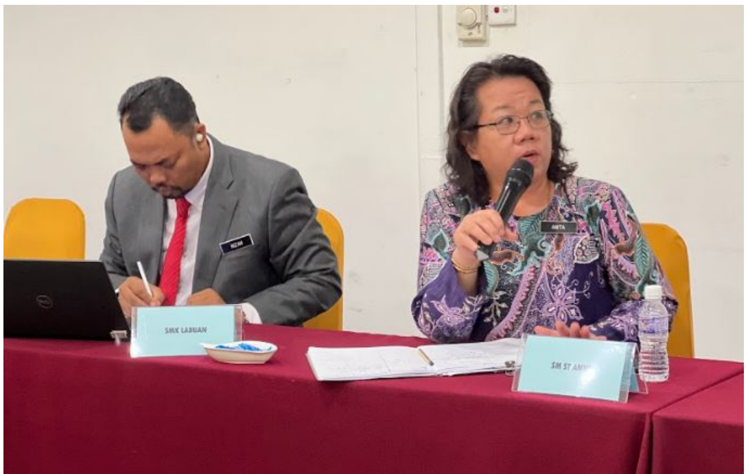
oleh Para Pengetua