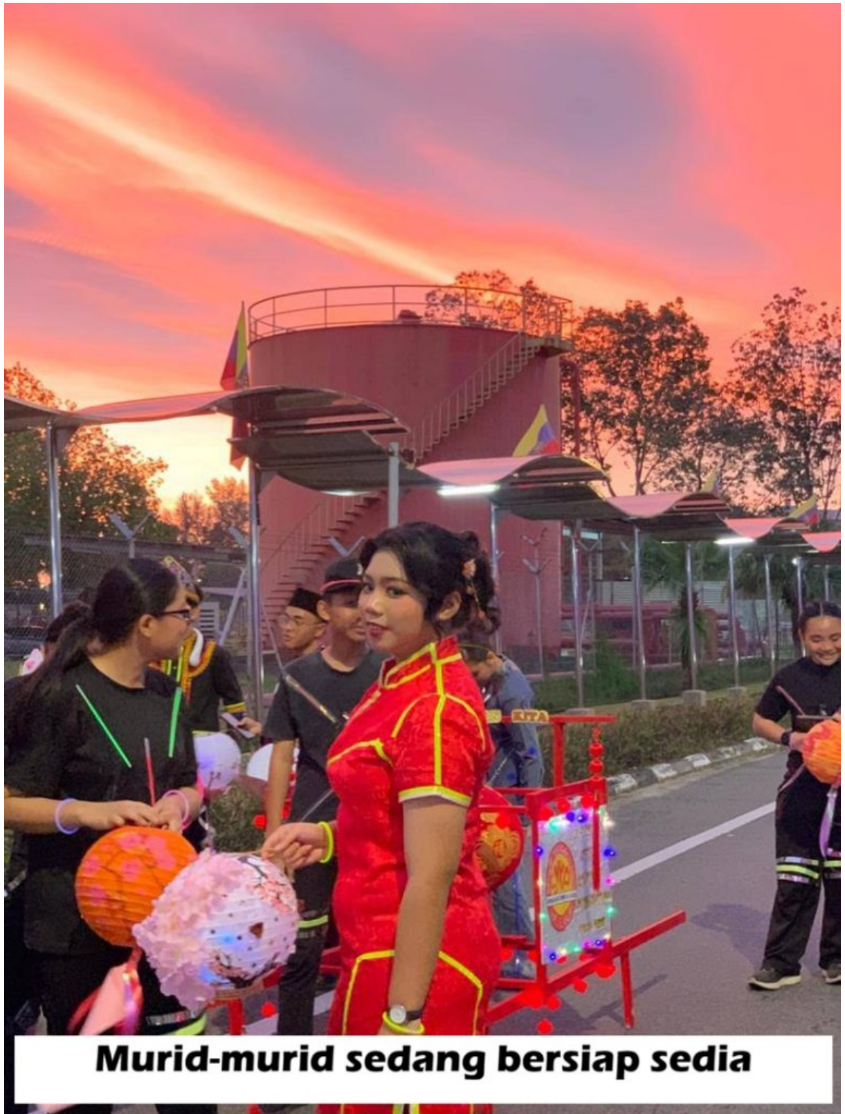
Murid-murid sedang bersiap sedia