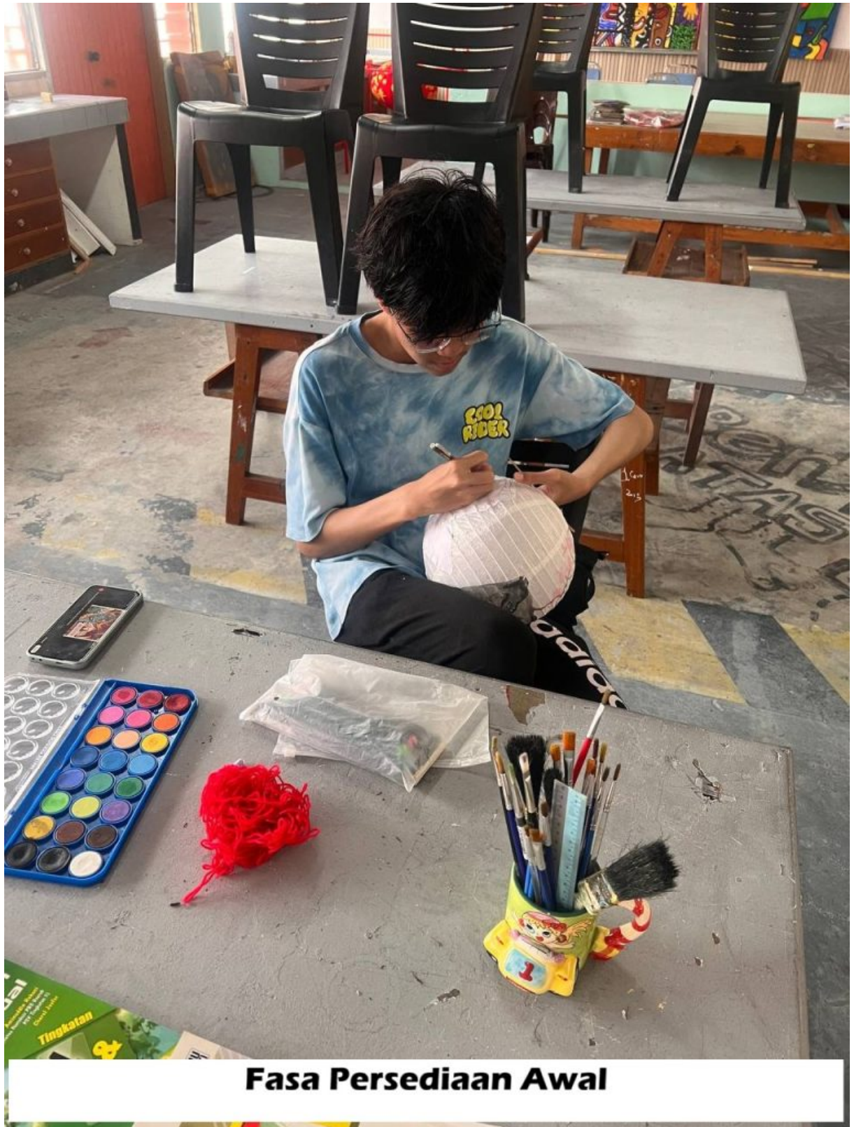
Fasa Persediaan Awal