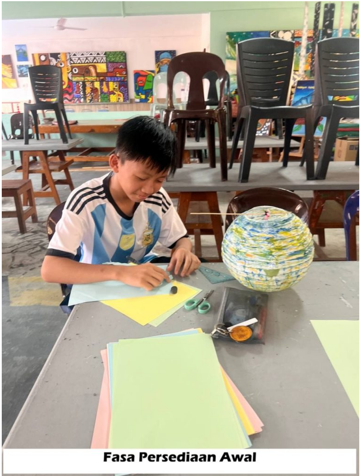
Fasa Persediaan Awal