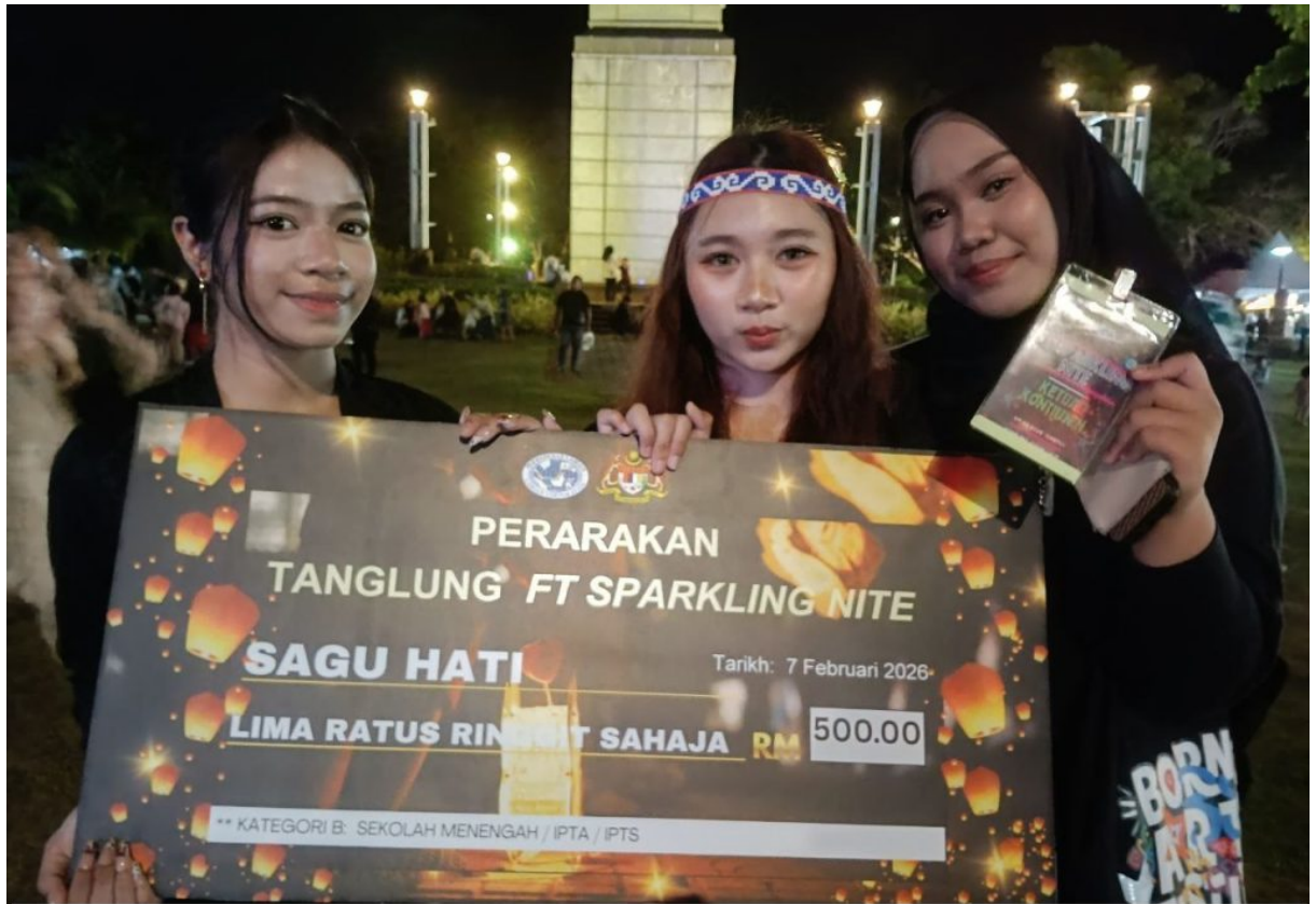
Murid-murid tampil bersama dengan hadiah cek RM500