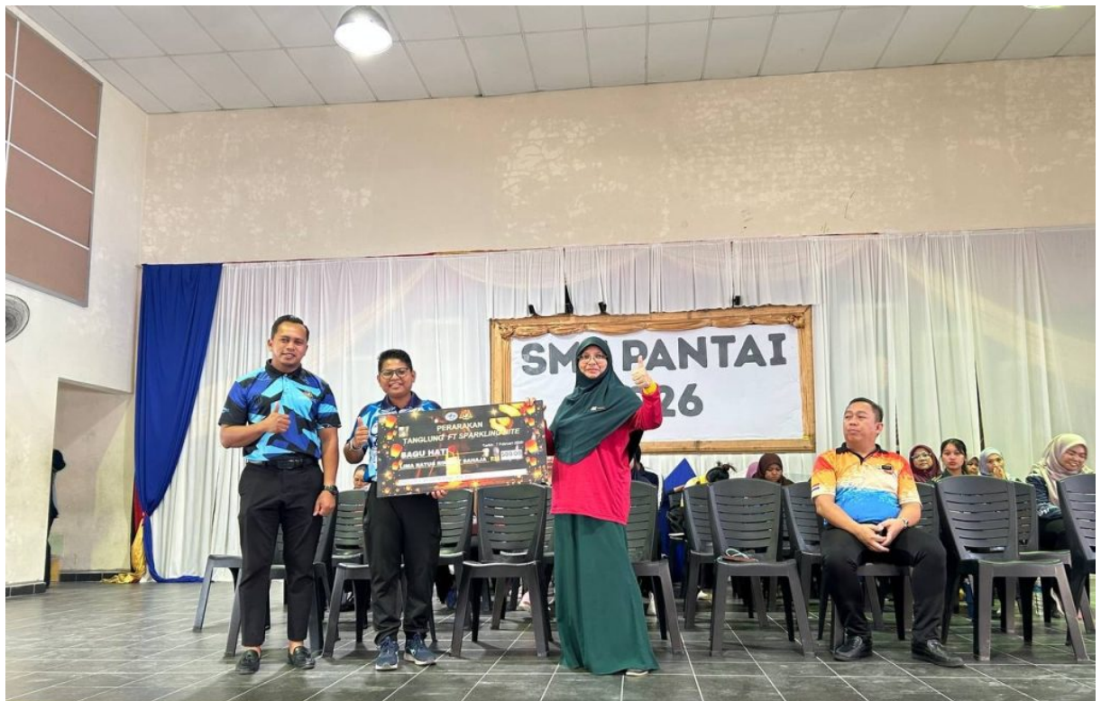
Kejayaan ini diraihkan bersama dengan warga sekolah di perhimpunan khas KOKUM pada hari Rabu.