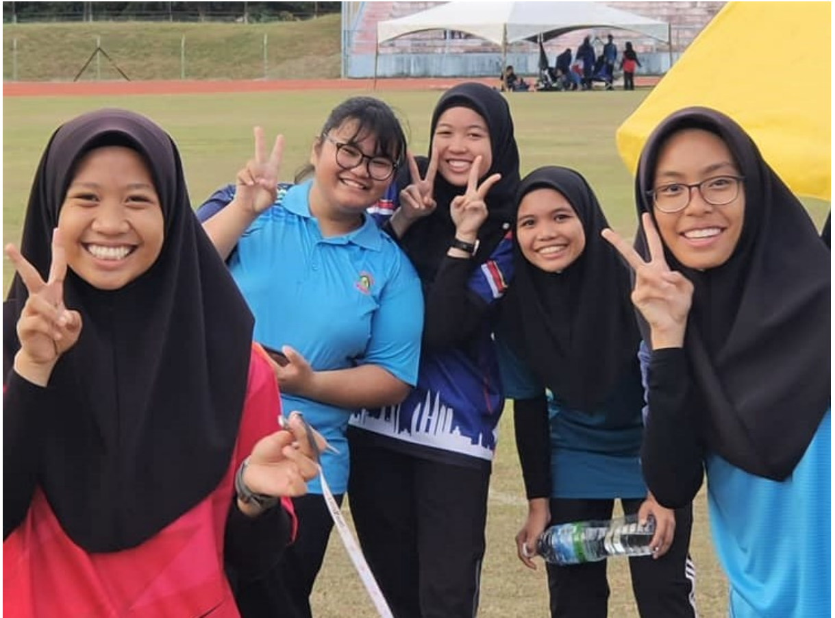
Wajah ceria murid-murid SMK Mutiara