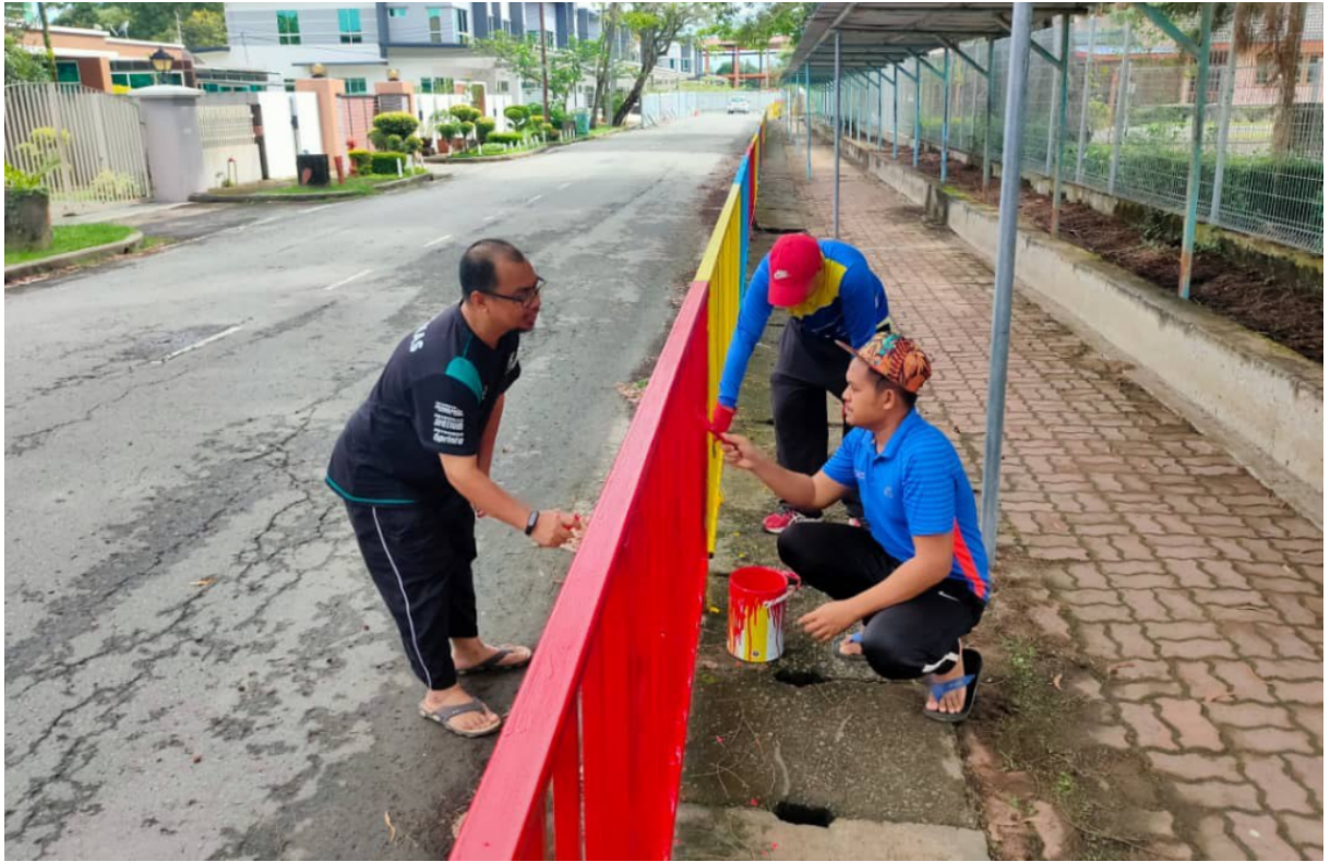
Saling bekerjasama mencerikan sekolah