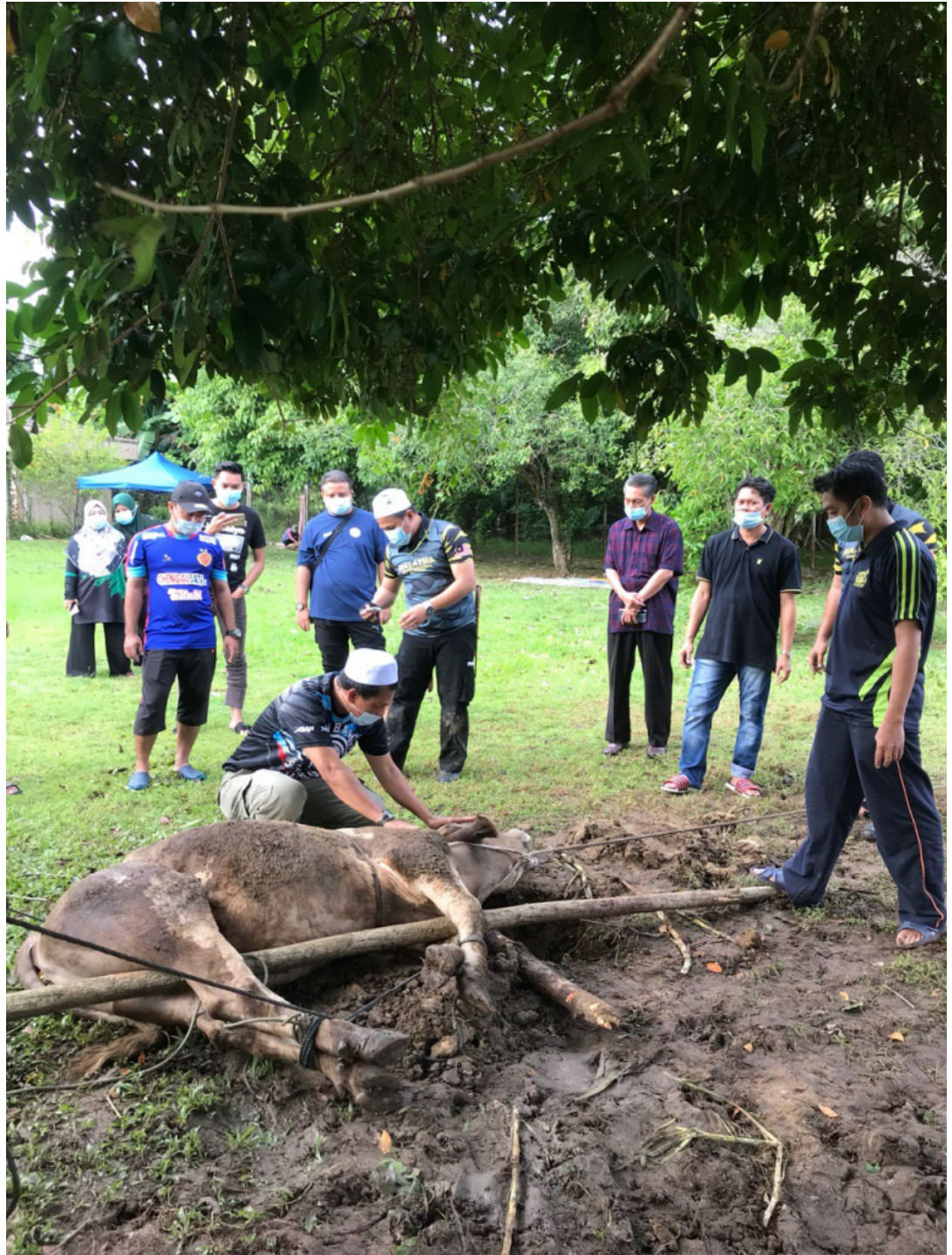
Bersiap sedia untuk sembelihan korban