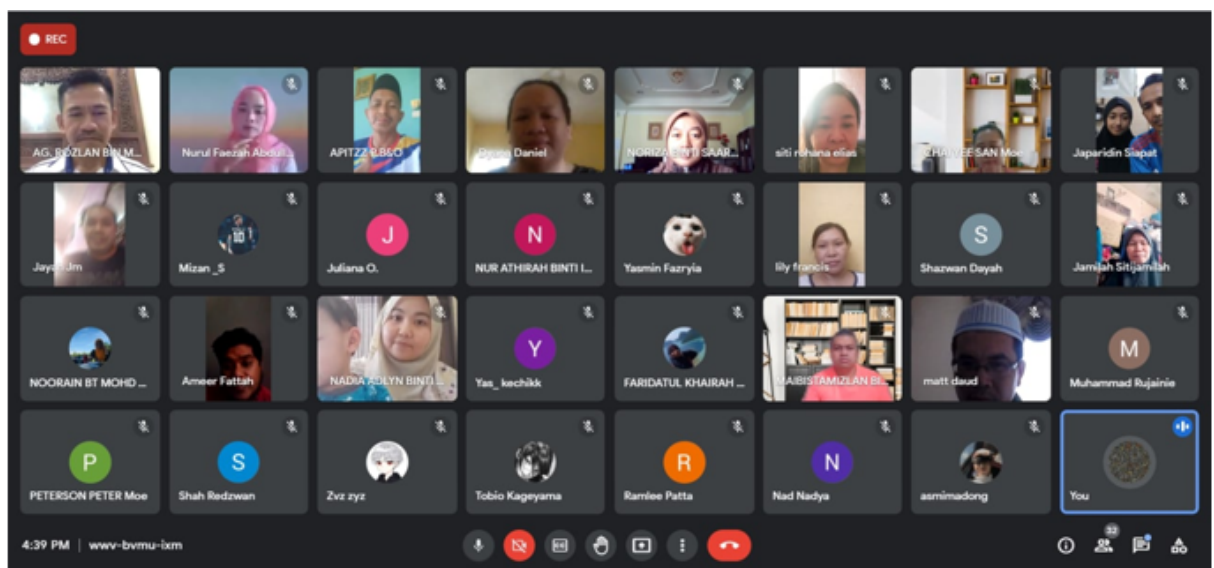
Kehadiran murid 5 Gamma / PVMA dan ibu bapa (25 Jun)

Berita Oleh : SMK Taman Perumahan Bedaun