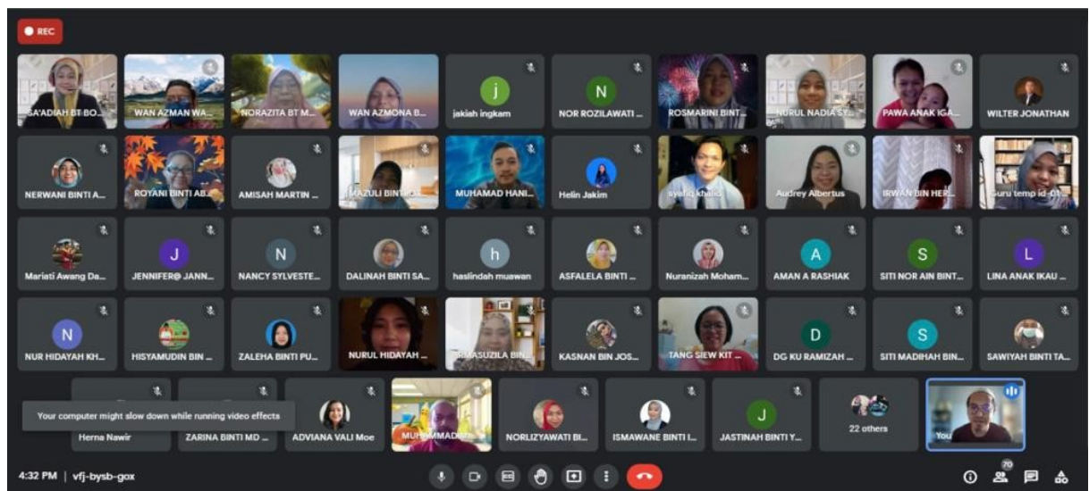
Antara peserta dalam Majlis Sepakat Menabur Bakti