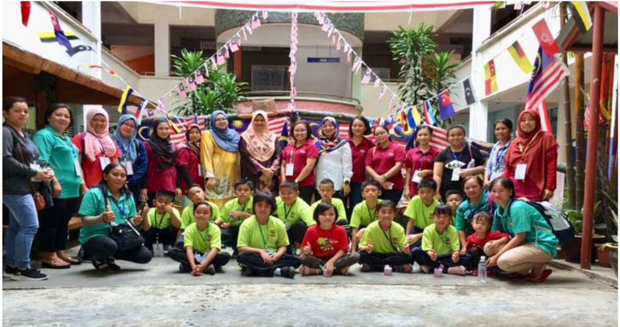
Para pentadbir SK Pekan Satu bersama rombongan lawatan KPKP Sk Kemabong Tenom, Sabah.