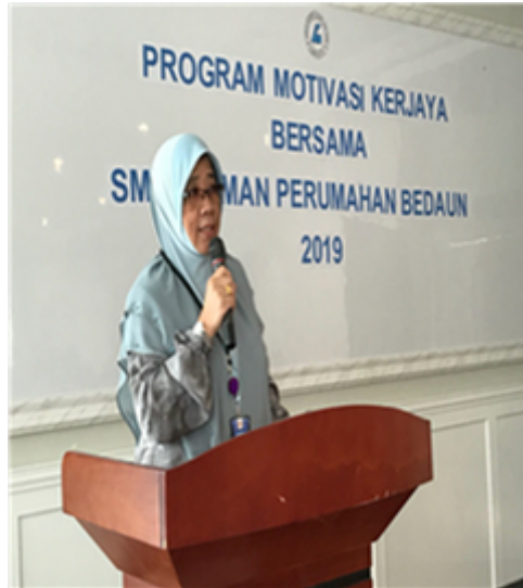
Ucapan Puan Hj Jijah