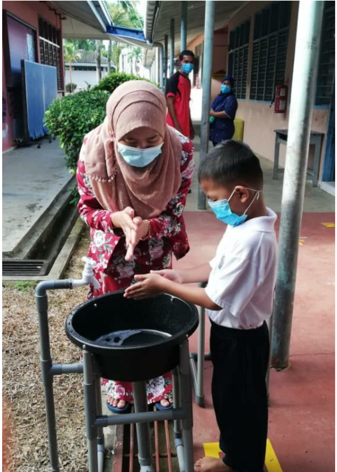
Murid diajar mencuci tangan dengan betul