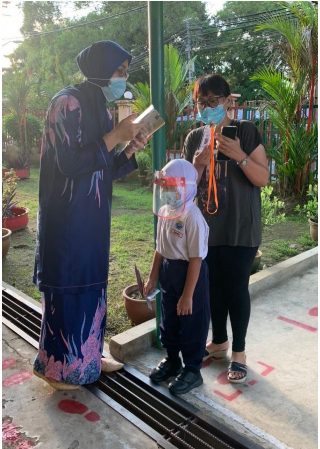
Imbasan suhu sebelum memasuki kawasan sekolah

15 tadika swasta juga dibuka hari ini melibatkan 1,513 orang murid.