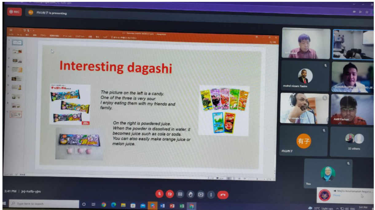
Antara makanan ringan di Jepang