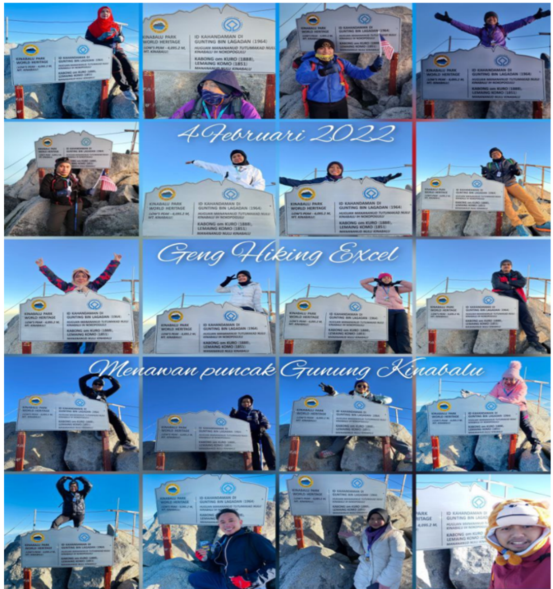
Semua pendaki GHE telah berjaya sampai ke puncak