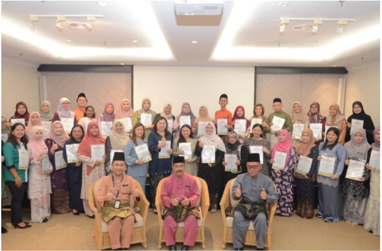
Tuan Pengarah bergambar bersama semua penyumbang bahan buku Koleksi Contoh Bahan Pengajaran & Pembelajaran Pedagogi Terbeza.