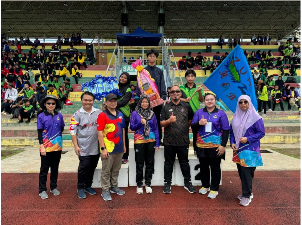
Juara sorakkan rumah sukan (Zuhal)