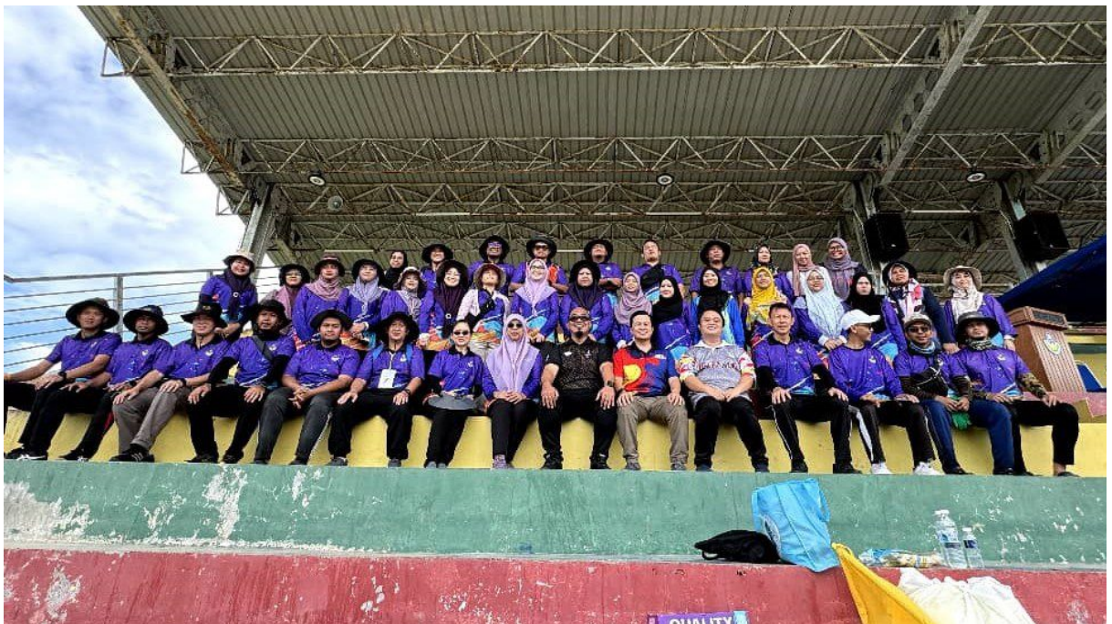
Barisan VIP, pentadbir dan guru SMKTPB