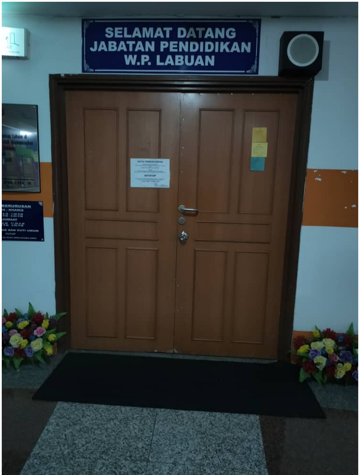
Pejabat Jabatan Pendidikan WP Labuan di Ujana Kewangan ditutup dari 18-31 Mac 2020