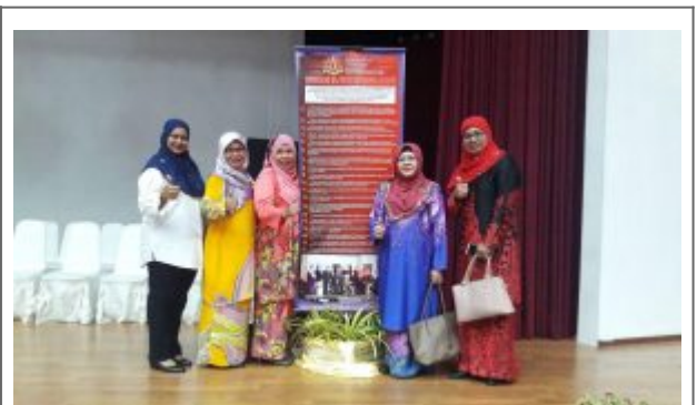
Para Guru Besar WP Labuan bersama 'bunting' deklarasi 1Borneo