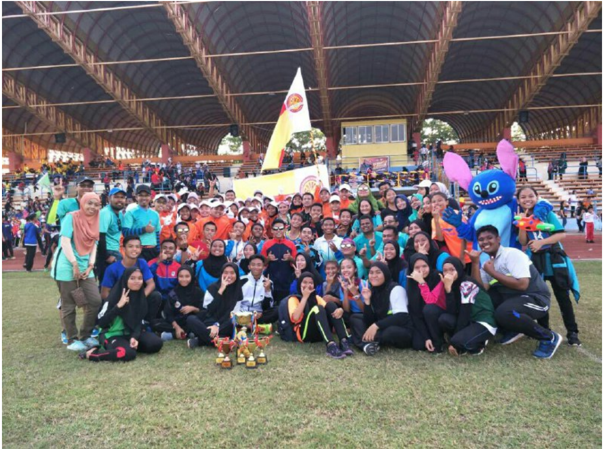
Gambar kenangan : Juara Keseluruhan MSSWPL 2018 SMK Pantai IBWS

Encik Sahar berharap SMK Pantai IB World School akan dapat mempertahankan kejuaraan pada Tahun 2019 menerusi latihan berterusan dan kesungguhan para atlet. Di samping itu atlet terus berusaha menaikkan nama Labuan dalam Kejohanan MSSM nanti dengan membawa pulang pingat emas.