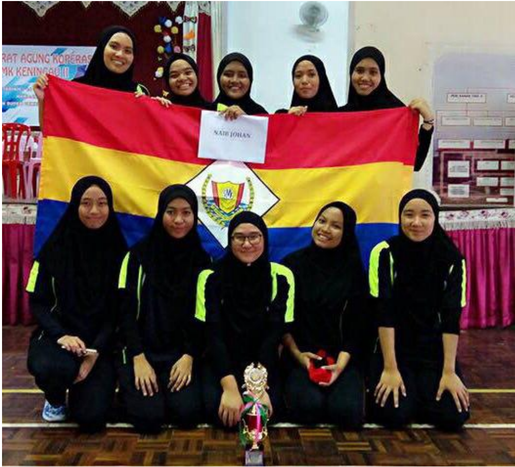
Pasukan bola jaring SMKL mendapat naib johan

Lima orang guru SMK Labuan turut sama menyertai 16 pelajar Pra U menyertai Karnival Tingkatan 6 tersebut :