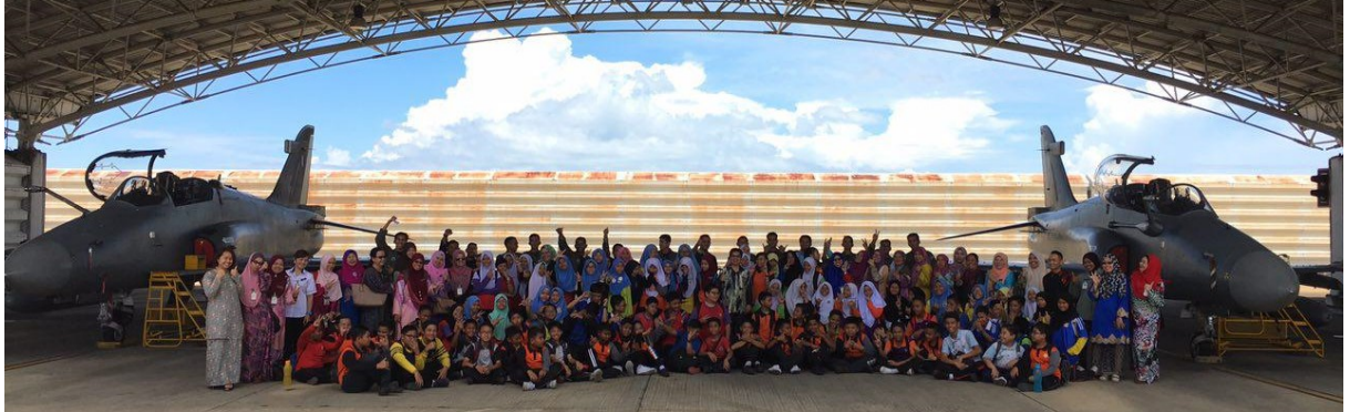
Gambar kenangan bersama Pegawai dan Jet Pejuang Tentera Udara DiRaja Malaysia (TUDM)