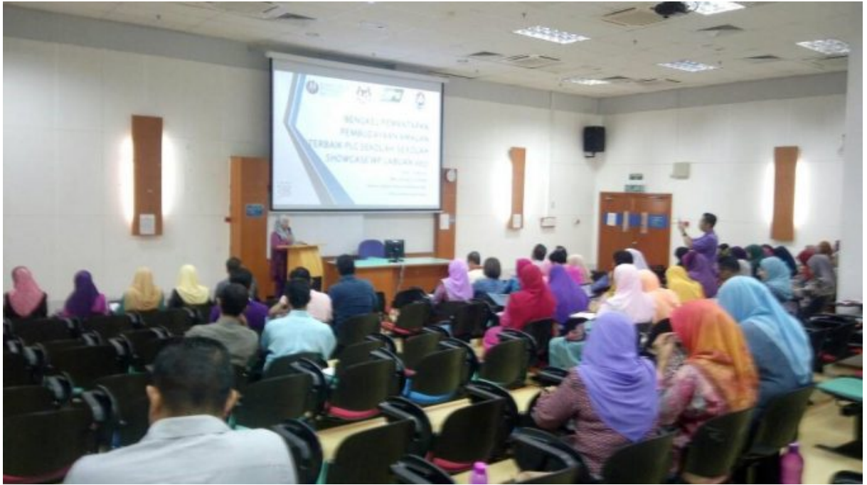
Peserta bengkel yang hadir