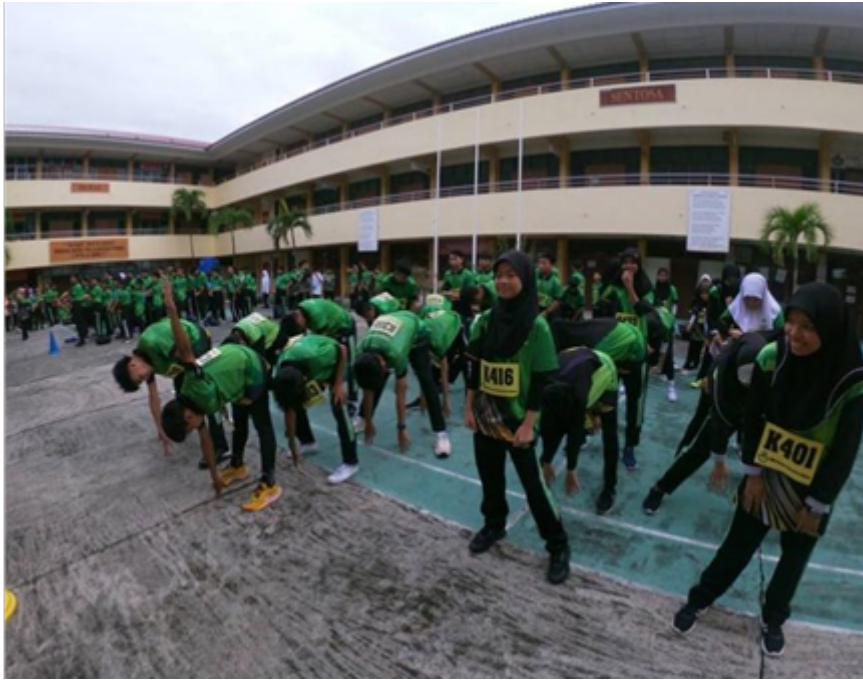
Aktiviti panaskan badan sebelum memulakan acara