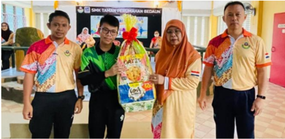
Penyampaian hadiah keseluruhan kategori Lelaki Bawah 15 Tahun kepada Rumah Sukan Zuhal