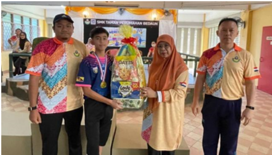
Penyampaian hadiah keseluruhan kategori Lelaki Bawah 18 Tahun dan Perempuan Bawah 18 Tahun kepada Rumah Sukan Marikh