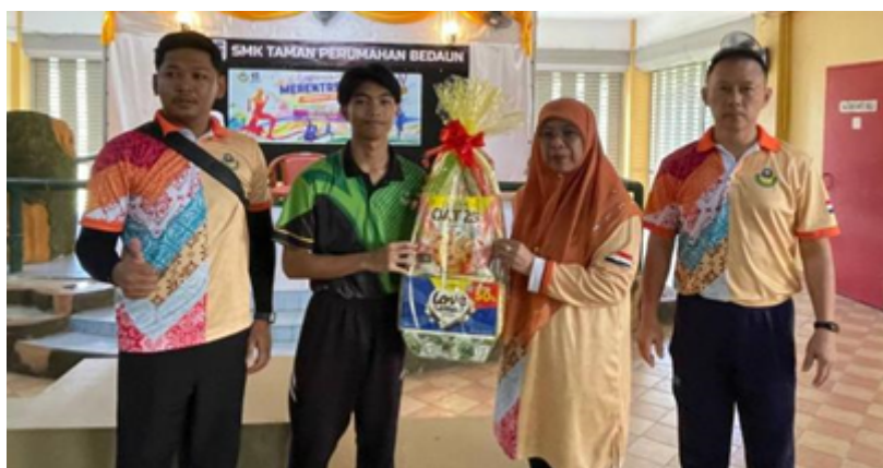
Penyampaian hadiah keseluruhan kategori Perempuan Bawah 15 Tahun kepada Rumah Sukan Neptune