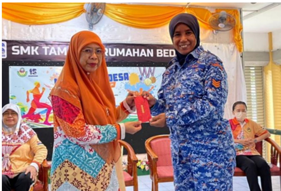
kepada anggota polis dan Angkatan Pertahanan Awam