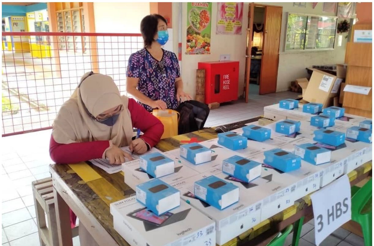
Guru-guru SMK Mutiara bertungkus lumus membantu mengagihkan peranti kepada murid