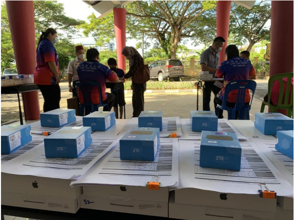
Proses pengagihan peranti SJK (C) Chi Wen berjalan lancar