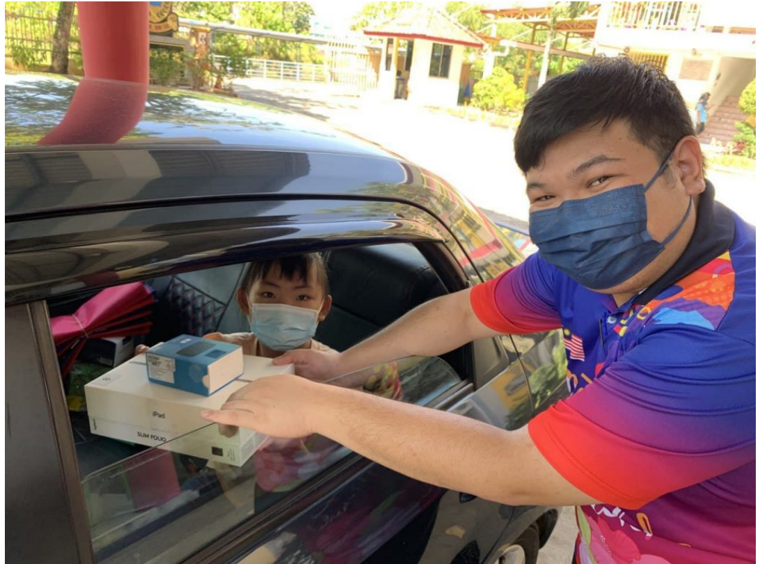
menyampaikan peranti iPad kepada ibu bapa dan murid