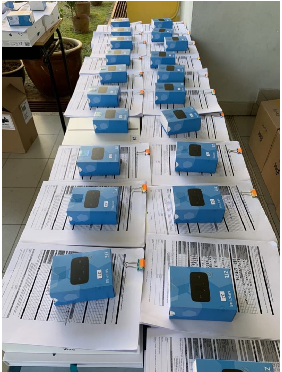
Pengagihan SJK(C) Chi Wen