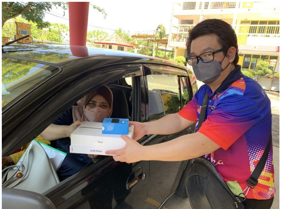
Guru SJK(C) Chi Wen