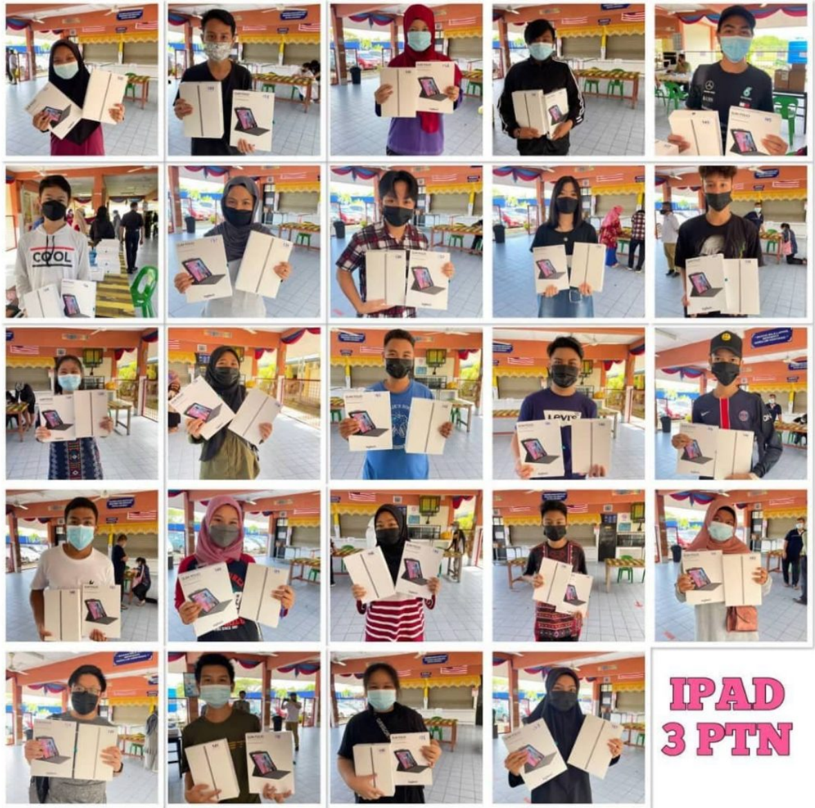
Wajah ceria murid-murid Tingkatan 3 SMK Mutiara bersama peranti iPad