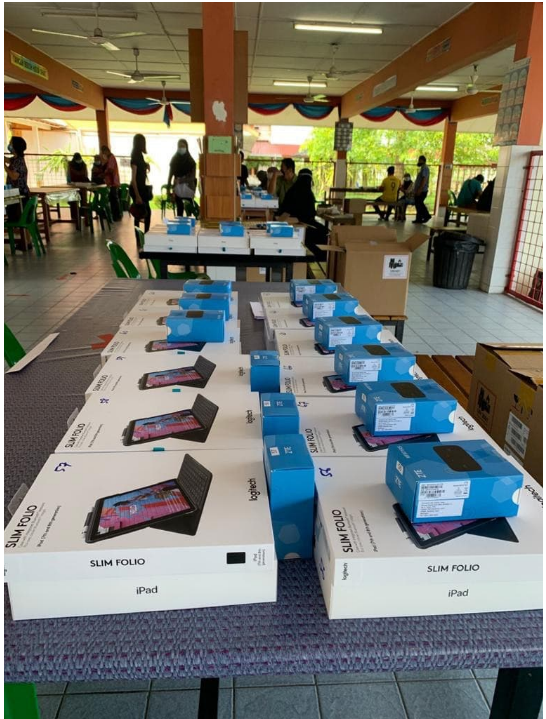
Pengagihan SMK Mutiara