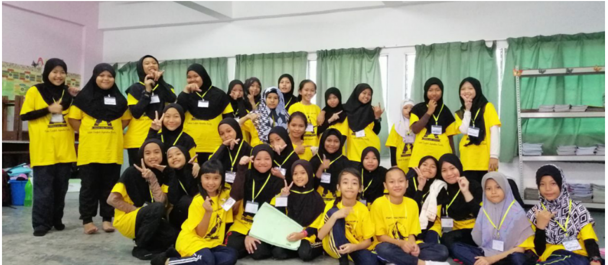
Peserta SEAS merakamkan gambar kenangan di bilik penginapan mereka di SJKC Pei Yin, Membakut.