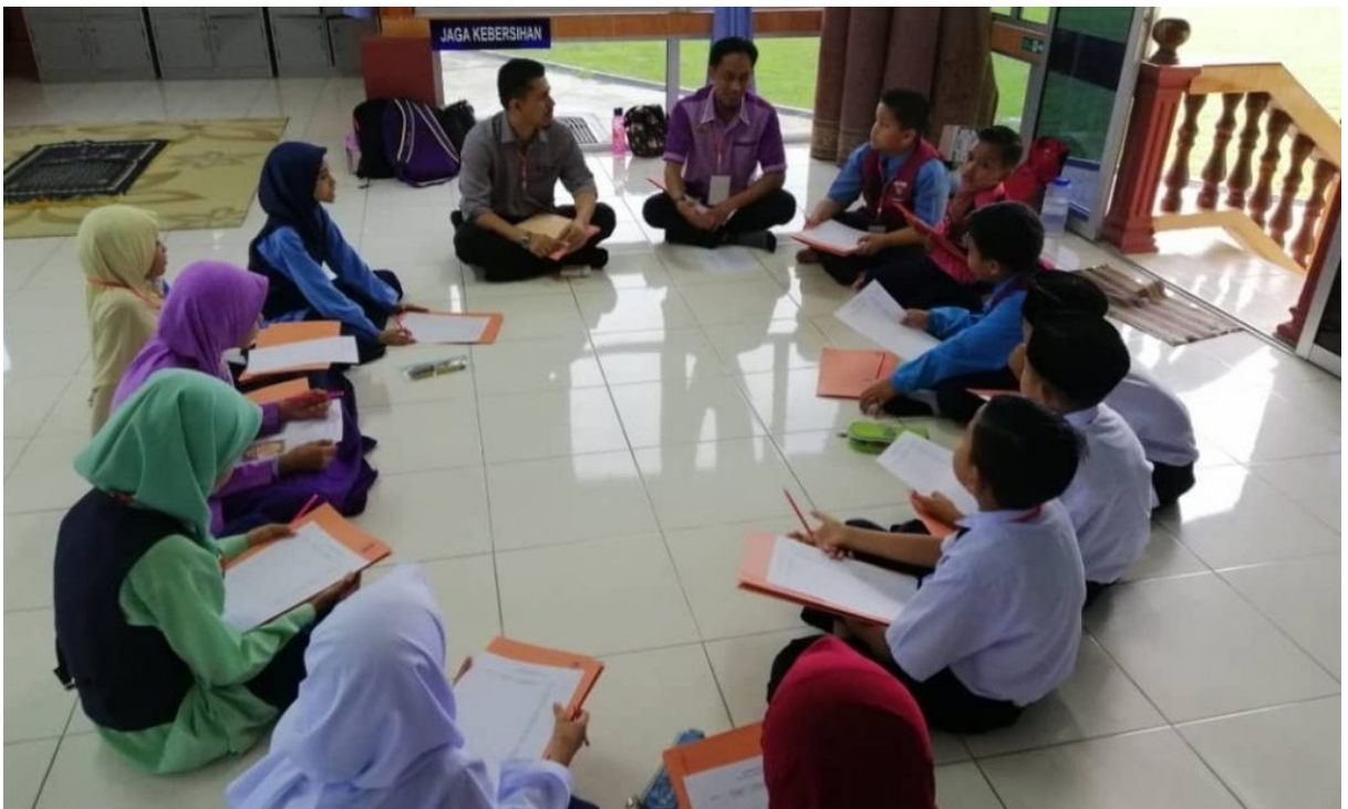
Latihan Dalam Kumpulan Modul Tahsin dan Tarannum