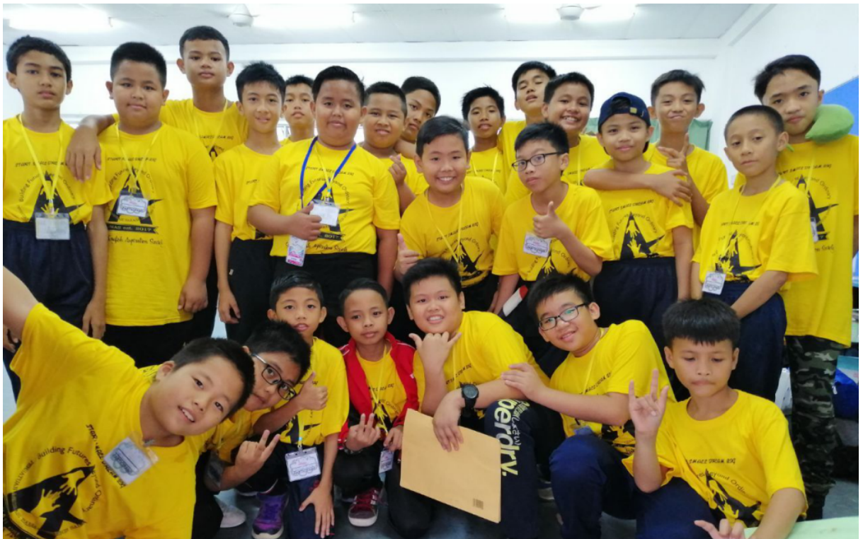
Peserta SEAS lelaki begitu ceria bergambar bersama rakan-rakan mereka daripada pelbagai sekolah yang mengikuti kem.