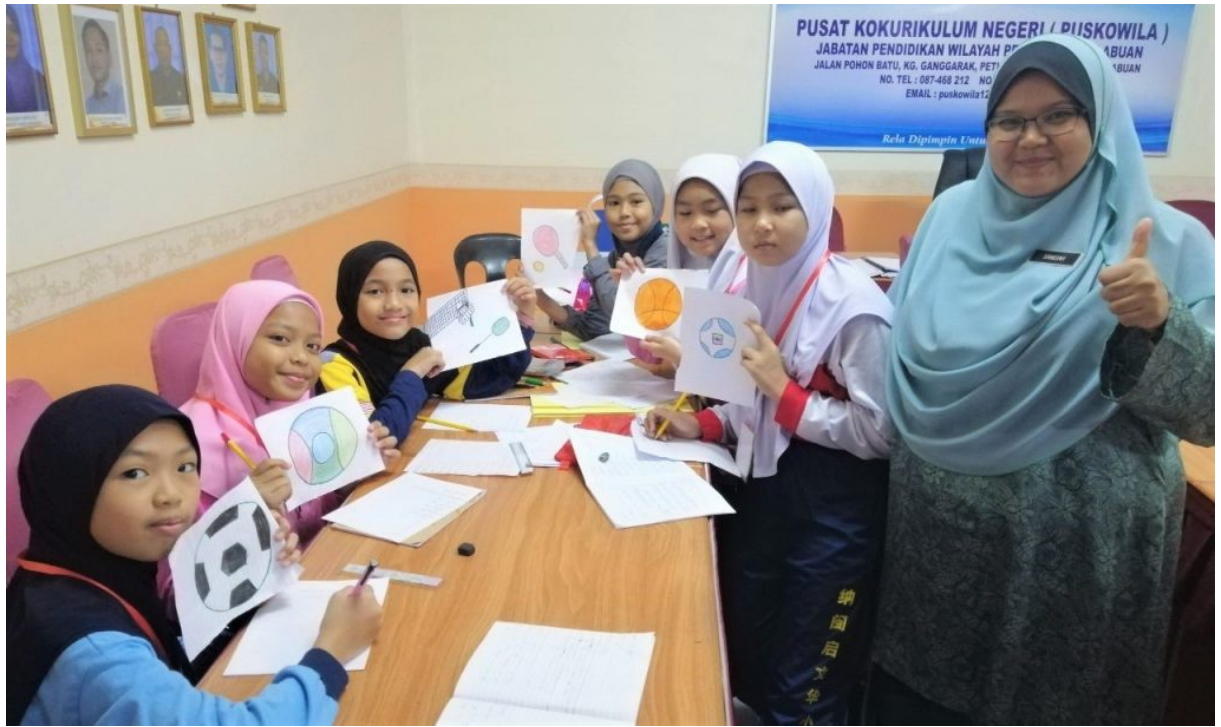
Latihan Dalam Kumpulan Modul Bahasa Arab (Hiwar)