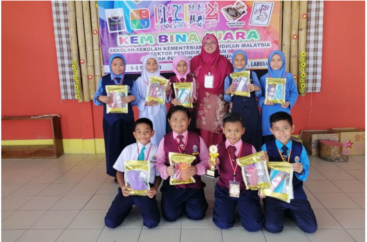
Peserta dari SK Sungai Bedaun merakamkan gambar kenangan Program Kem Bina Juara 2019