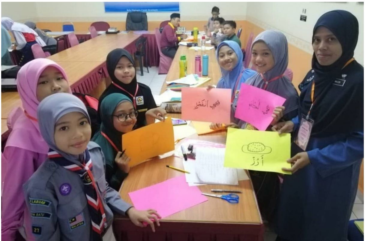
Latihan Dalam Kumpulan Modul Bahas Arab (Hiwar)