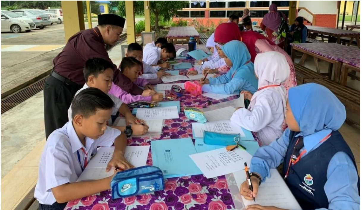
Latihan Dalam Kumpulan Modul Jawi dan Khat