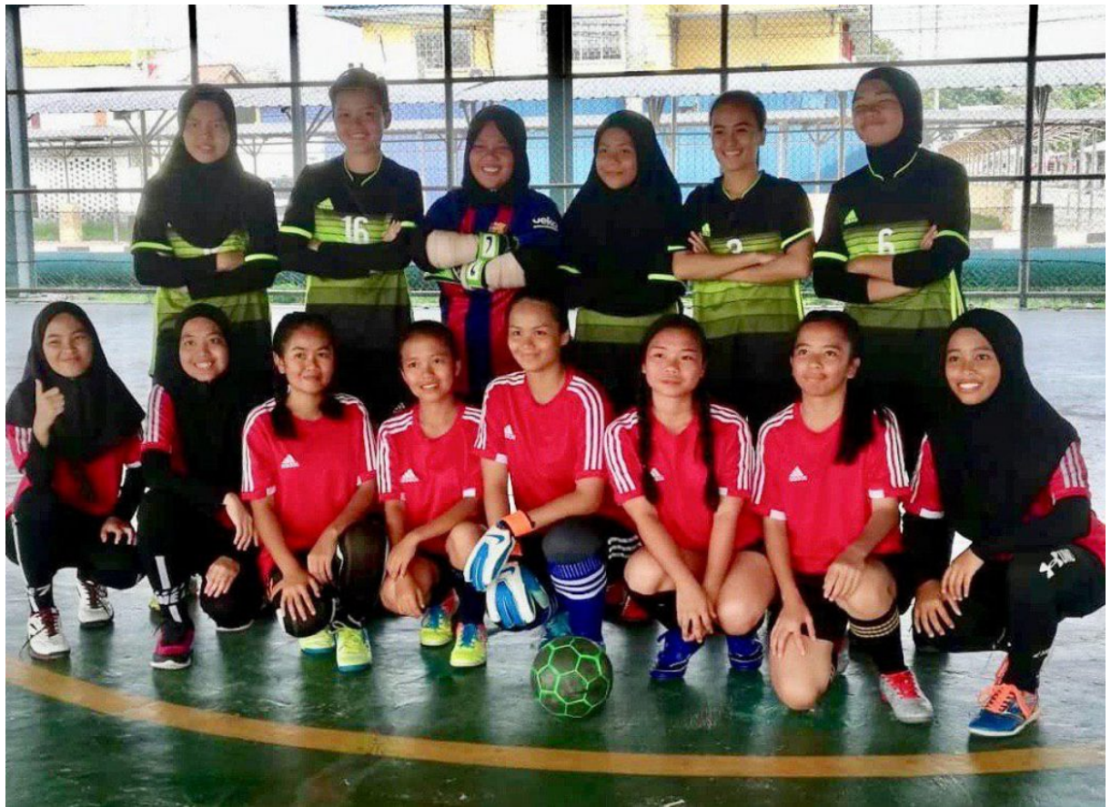
SMKL (berdiri) Naib Johan Futsal perempuan, bersama Johan SMKPO (duduk)